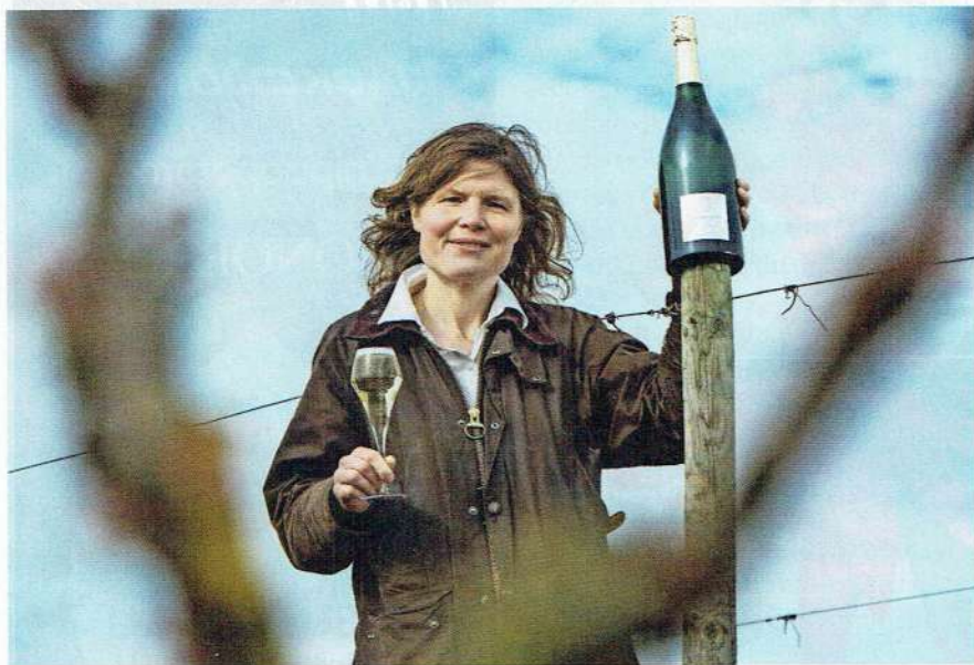
Liv peut savourer son verre de crémant, elle a surmonté les embûches pour réaliser son rêve.